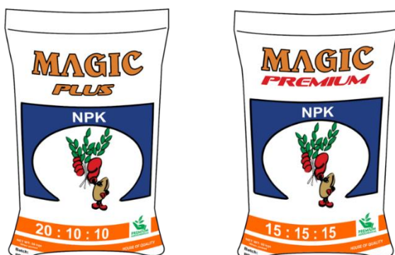
Image of the chemical fertilizer packaging planned for sale